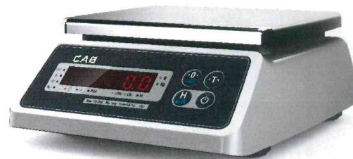
Весы с пылевозооащитным исполнением оболочки (корпуса)