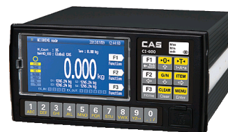
Цифровой индикатор CAS CI-600D